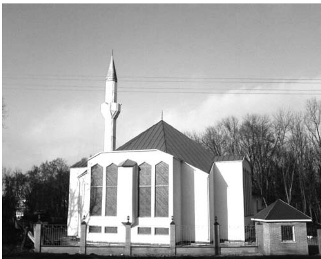
Рис. 3. Мечеть на ул. Фурмановской

ношение было вполне лояльным. Такого рода осложнения характерны почти для всех случаев строительства мусульманских храмов на территориях, где исконно проживает русскоязычное население. Подобные ситуации вряд ли можно рассматривать как конфликты на религиозной почве, это скорее свидетельствует о наличии элементов кавказофобии и исламофобии в современной России.