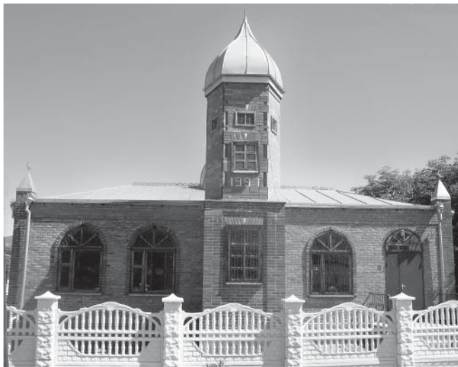
Рис.3. Мечеть в ауле Красный Восток. 1997 г.

ру, направления и принципы работы Духовного управления. Верховным органом, обладающим правом принимать ключевые решения, был определен съезд. Именно съезд должен избирать президиум Духовного управления во главе с муфтием и ревизионную комиссию, заслушивать и утверждать отчеты о проделанной работе. Высшим органом управления между съездами был определен пленум, в компетенцию которого передавалась подготовка съезда и контроль за исполнением принятых решений, ведение принципиальных вопросов внутренней и внешней деятельности муфтията, рассмотрение жалоб на членов президиума, а также разрешение спорных вопросов. Ответственность же за весь комплекс текущих проблем, осуществление представительских функций возлагались на муфтия, который признавался главой мусульман региона. Муфтий получал исключительное право решения