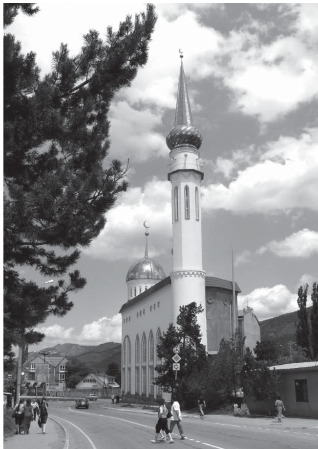
Рис. 7. Соборная мечеть Карачаевска

Прикубанского района). Уже давно не стоит задачи просто обеспечить верующих помещением для молитвы – мечеть становится украшением населенного пункта, его культурным центром. Изящная, стройная конструкция Соборной мечети Карачаевска, увенчанная золотыми куполами, стала настоящей городской достопримечательностью, привлекающей внимание многочисленных туристов, направляющихся в Теберду и Домбай (рис. 7).