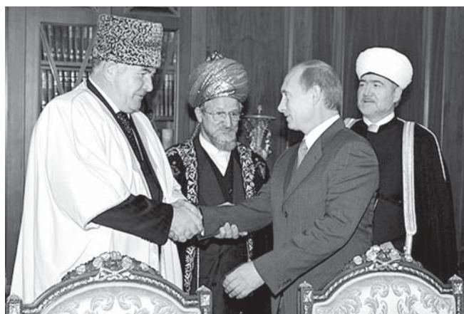
Рис. 5. Встреча российского исламского духовенства с В.В. Путиным

Острый конфликт, выплеснувшийся на страницы прессы, возник в Ставропольском крае в связи со стремлением части мусульманских общин выйти из состава ДУМКЧиС. В большей или меньшей степени с серьезными проблемами столкнулись практически все кавказские муфтияты. Трагедия в Беслане вызвала всплеск антиисламских настроений среди местного населения. Острые трения между молодежью и традиционалистским духовенством в Кабардино-Балка-