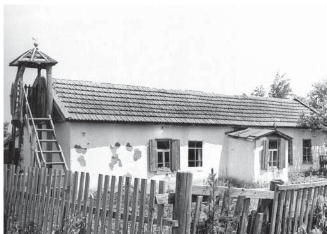
Рис. 6. Мечеть в ауле Икон-Халк. 1960–1970-е гг.

с молельной имеется одна маленькая комнатка, в молельне два Корана и четыре лампы, во дворе мечети несколько деревьев, мечеть огорожена каменным забором, инвентаря и другого имущества не имеется у мечети». Здание мечети оценивалось в 500 рублей, минарета – 25 рублей, каменной ограды – 70 рублей 1 . В карачаевских аулах были распространены квартальные родовые мечети, которые так и назывались: «мечеть Байрамуковского квартала», «мечеть Чомаевского квартала» (в ауле Хурзук) 2 . Мечеть 1950–1980-х гг. отличалась от скромного жилого домика только небольшим минаретом (иногда в виде помоста с лестницей), сооруженным из досок, арматуры или жести 3 (рис. 6). Часто не было и его.