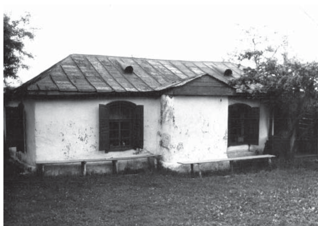
Рис. 2. Мечеть в ауле Красный Восток. 1960–1970-е гг.

Формирование организационной структуры ДУМКЧиС. Важным направлением работы Духовного управления являлось создание эффективной административной системы. На втором съезде был принят устав, определявший структу-